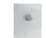
HUELLA INDICE DERECHO